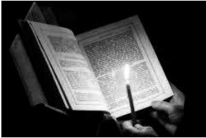
Στασίδι, κερί, οκτωήχι

Για τους ίδιους τους Ρωμιούς, κληρονόμος ήταν το «Γένος», λέξη που δηλώνει άμεση, γενετική σχέση με την Βυζαντινή Αυτοκρατορία, έτσι όπως την αισθάνονταν πάντα μέσα τους οι Ρωμιοί.