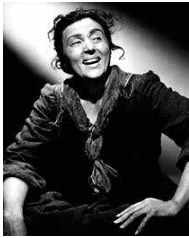
Στο ρόλο της Πιλάρ