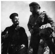
Εικόνες ομοφυχίας κατά την Εθνική Αντίσταση

Το Ελληνικό Έθνος άντεξε αιώνες την Οθωμανική σκλαβιά, μέχρι που επαναστάτησε, αγωνίστηκε και πέτυχε με συνεχείς αγώνες και θυσίες την ανεξαρτησία του, την προκοπή και την αξιοπρέπειά του. Δεν είχε ακόμη αναρρώσει πολιτικά από τον Εθνικό Διχασμό, ούτε οικονομικά από τη Μικρασιατική Καταστροφή, όταν τα μαύρα σύννεφα μιας νέας καταιγίδας, παγκόσμιας αυτή τη φορά, εμφανίστηκαν στον ορίζοντα απειλητικά.