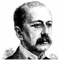
Ο εκσυγχρονισμός της Ελλάδας