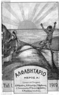
Το «Αλφαβητάρι», εξώφυλλο

Γυρίζοντας στην Αθήνα το 1907 αρθρογράφησε στην εφημερίδα «Ακρόπολις» και το 1908 ανέλαβε τη διεύθυνση του Ανώτερου Παρθεναγωγείου του Βόλου. Εκεί για δύο χρόνια πρωτοπόρησε στην εφαρμογή της δημοτικής αλλά και των νέων παιδαγωγικών μεθόδων σύμφωνα με τις νέες ευρωπαϊκές παιδαγωγικές θεωρίες. Η εκπαιδευτική τομή δεν ήταν μόνο στη γλωσσική επιλογή αλλά και στη μεταστροφή από «το ραγιαδισμό και τις ασυναρτησίες των παπαγάλων», προς την καλλιέργεια της παρατήρησης και της κρίσης, προς την έκφραση λόγου με ζωντάνια και ακρίβεια. Η δημοτική γλώσσα όχι μόνο μπορούσε αλλά και έπρεπε να είναι το κατάλληλο όργανο γι' αυτόν τον σκοπό.