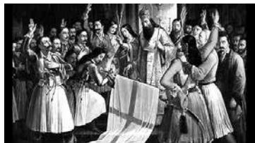
Πίνακας του Βρυζάκη: ο Παλαιών Πατρών Γερμανός ευλογεί τη Σημαία στην Αγία Λαύρα (σε φανταστική απεικόνιση)

«Όταν αποφασίσαμε να κάμομε την Επανάσταση, δεν εσυλλογισθήκαμε ούτε πόσοι είμεθα, ούτε πως δεν έχομε άρματα ούτε ότι οι Τούρκοι εβαστούσαν τα κάστρα και τας πόλεις, ούτε κανέννας φρόνιμος μας είπε «πού πάτε εδώ να πολεμήσετε με σιταροκάραβα βατσέλα;», αλλά ως μία βροχή έπεσε εις όλους μας η επιθυμία της ελευθερίας μας, και όλοι, και ο κλήρος μας και οι προεστοί και οι καπεταναίοι και οι πεπαιδευμένοι και οι έμποροι, μικροί και μεγάλοι, όλοι, εσυμφωνήσαμε εις αυτό το σκοπό και εκάμαμε την Επανάσταση», Πνύκα 7 Οκτωβρίου 1838.