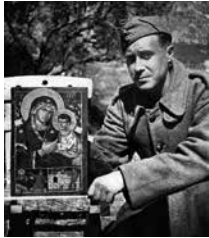
Ο Τσαρούχης στο μέτωπο κρατάει την «Παναγία της νίκης»

γνώριζαν –τον Τσαρούχη– για να την αγιογραφήσει. Αυτός ζωγράφιζε την εικόνα με τα χρώματα που χρησιμοποιούσε για καμουφλάζ στο αυτοκίνητο του Μεράρχου, πάνω σε καμβά από το καπάκι ενός κιβωτίου ρέγκας, που –όπως έλεγε– βρωμούσε ανυπόφορα. Η «Παναγία της Νίκης» του Τσαρούχη, αν και φιλοτεχνημένη με τόσο πρόχειρα υλικά, έγινε αμέσως αντικείμενο λατρείας της Μεραρχίας.