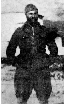
Ο Ελύτης στο μέτωπο