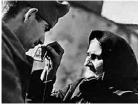
Το φυλαχτό της μάνας

Ο αγώνας του '40 σωστά ονομάστηκε έπος, γιατί χαρακτηρίζεται από ατομικό ηρωισμό και συλλογική αγωνιστική προσπάθεια, από δραματικό και μαζί διδακτικό στοιχείο, όλα κορυφωμένα σε τέτοια ένταση και μέγεθος ώστε να αφήνουν βαθύ αποτύπωμα στην ιστορία και στον ψυχισμό του Έθνους.