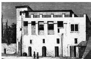
Το πρώτο κτίριο στην Πλάκα

Ας αναγνωρίσουμε πάντως ότι δεν αντιτάχθηκαν στην ίδρυση Πανεπιστημίου καθώς το είδαν –ορθά– ως ένα ίδρυμα που θα συνδέει πνευματικά – και πολιτικά– τη Βαυαρία με το νεοσύστατο Κράτος. Στον δημόσιο έρανο που διεξήχθη σε όλη την επικράτεια για την ανέγερση των Προπυλαίων –τα οικονομικά του κράτους δεν αρκούσαν– συνεισέφεραν γενναία τόσο ο Όθων όσο και ο πατέρας του και ένθερμος φιλέλληνας, Λουδοβίκος Α΄ της Βαυαρίας.