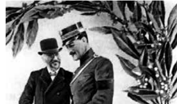
Εθνική ομοψυχία στους Βαλκανικούς Πολέμους