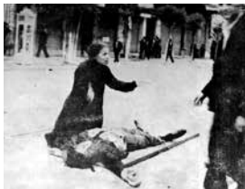
Η φωτογραφία που ενέπνευσε τον «Επιτάφιο»

Η σύντομη αυτή ήρεμη ανάπαυλα έληξε όταν το 1934 ο πατέρας του παραφρόνησε –μάλλον λόγω της ανέχειας– και μεταφέρθηκε στο Δημόσιο Ψυχιατρείο, όπου πέθανε το 1938. Έναν χρόνο μετά η αδελφή του επέστρεψε από την Αμερική με έναν γιό, αλλά σύντομα χώρισε με τον άντρα της, με αποτέλεσμα τον σοβαρό ψυχικό κλονισμό της. Ο Ρίτσος αναγκάστηκε πάλι να βιοπορίζεται εργαζόμενος ως χορευτής (!) και ως ηθοποιός σε διάφορα θέατρα, εμφανιζόμενος με ψευδώνυμο.