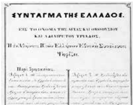
Το Σύνταγμα του 1844